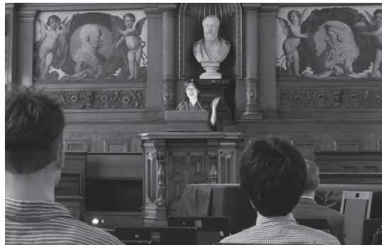
講演中の筆者 ハイデルベルク大学旧講堂(Alte Aula)にて

私はこの間、隠逸の閑居を享受した学者であったのか。それとも国産思想の輸出業務に勤しむ、働き詰めの商社駐在員であったのか。否、寧ろ両者何れでもない者としての生き方の端緒こそを私は異国での独居を通して掴みえたように思う。はてさて嚮後、新帰朝者は「中隱の士」(白居易) たりうるや否や。