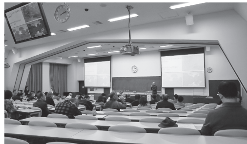
2017年12月3日開催 公開シンポジウム